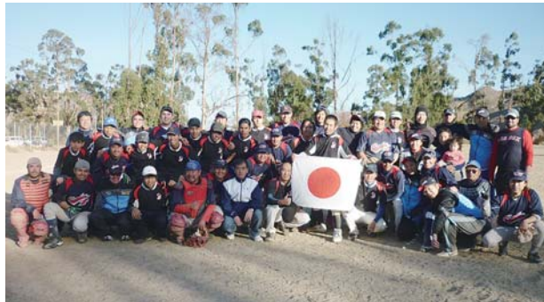
2012年7月14日にラパスで開催された野球大会

る。男たちの主な楽しみは川での魚釣りで、毎年釣り大会が開催されるとのことである（最近では以前ほど釣れなくなったとの噂も）。