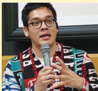
バーナード・チョーリー監督