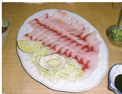
サン・ファン移住地近くの川魚の刺身

米、大豆、柑橘類、マカダミアナッツ、牛肉、鶏卵などであり、米はボリビア国内でも有数の産地となっており、日本米も作られてい