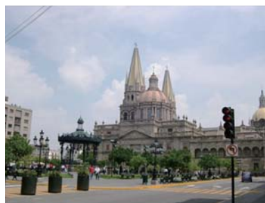
the Cathedral of Guadalajara

In the seventeenth century the New Spain (Mexico) had established close relationships with Asia. The Galleon of Manila made transpacific voyages every year from Manila to Acapulco for more than two centuries (1665-1810). In these long journeys Japanese, Chinese and Philippines traveled to New Spain in the Galleon or directly from Japan.