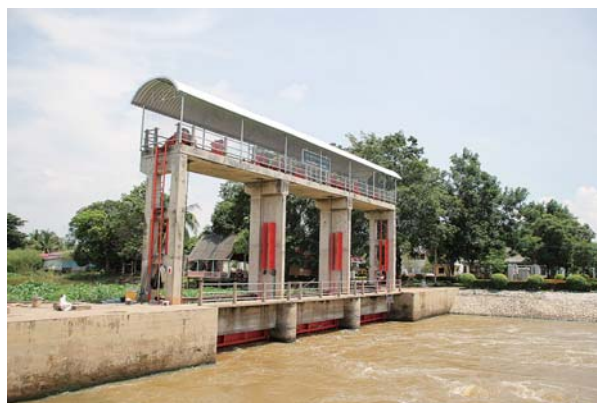
チャオプラヤデルタの水流を制御する水門の一つ。制御方法を巡ってしばしば農民たちが抗議に押し掛ける。

2011年のタイ国チャオプラヤ川大洪水の際には、日系企業が立地する工業団地やバンコクの被災状況が日本でも大きく報じられたが、その陰でバンコク周辺の農村部もまた、一か月以上の長期にわたって冠水状態に置かれた。チャオプラヤデルタは元来洪水常襲地域である。上流のダム建設や治水事業に伴って頻度や規模は減少しているものの、洪水年には本流や支流沿いで河川氾濫が生じるという状況は未だ変わっていない。そして氾濫水や氾濫を生じ得るような河川流出は、水門の操作や堤防・土嚢によって経済的重要度の低い農村部へと人為的に導かれる（あるいは留め置かれる）のである。2011年大洪水後の治水対策にも、バンコク上流の水田地帯を遊水地として活用する計画が盛り込まれた。これは地権者への補償を伴うもので、暗黙の了解のもとに農村部が氾濫水を受け入れてきた状況からの進歩とはいえるが、農村部でもまた生活様式や農業体系の変化により洪水に対する脆弱性は増加している。本研究では、洪水頻発地域であるタイ国チャオプラヤデルタの水田地帯において農民たちがどのように洪水に対応しているかを明らかにした上で、現在タイ政府が進めているチャオプラヤデルタにおける治水対策が、農村部に負担を押し付けない形でどのように実施可能かを示す。