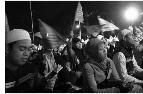
写真1 数千人を集めたジャカルタでのマウリド (預言者ムハンマドの生誕祭) の様子

ら、NUに帰属意識をもつ回答者は三つの宗教儀礼に肯定的である。他方でムハマディヤのメンバーはタフリランに肯定的である。