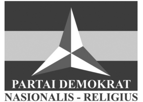
図2 2009年総選挙における民主主義者党のロゴマーク「宗教的・ナシヨナリスト」

したがって、「敬虔か否か」と政党支持には依然としてある程度の関連性を見いだすことができる。しかしながら従来のイスラーム/世俗・ナシヨナリスト政党の二分法では捉えられないことは明らかであり、とりわけ民主主義者党は宗教活動の実践に熱心なムスリムの支持を受けていることが分かった。