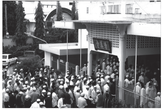
写真1 チェンマイ県バーン・ホー・モスクで行われた断食明けの祈りをする雲南系ムスリム

圧倒的な資金提供者はタイ国内に住む雲南系ムスリムたちであったが、当時北タイに偶然足を運んでいたサウジアラビアの商人の目に彼らの宗教活動がとまり、それがきっかけとなり、多額の寄付がサウジアラビアから寄せられた。このほか海外からの寄付では、マレーシアや中東のカタール、リビア、アラブ首長国連邦、クウェート、チュニジア、バーレーン、オマーンなどのイスラーム諸国がある。しかし、中東を中心としたムスリムからの寄付とは対照的に、台湾やビルマ、中国のムスリム同胞からの寄付は一九七〇