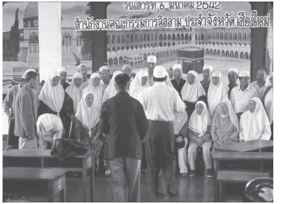
写真2 1999年に実施されたマッカ巡礼に向けた合同集会。写真を撮っているのがチェンマイの雲南系ムスリムで、集合写真のため並んでいるのが中国やビルマから参加したムスリム

ともバーン・ホー・モスクの教区員である。三人のうち、C氏が巡礼の勧誘やその代行業を請け負うが、マッカ巡礼に行くのは異母兄弟の妹夫婦である。いづころ巡礼団を組織したのは不明である。