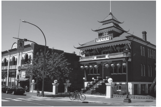
写真2 このとき成立したビクトリア中華会館（写真右）

則を作成し、募金から設立経費を捻出して運営するという手順をビクトリア華商に示した。次いで、サンフランシスコから二名の領事館員をビクトリアに派遣し、中華会館を立ち上げる一連の準備を指導させた。二名の領事館員は、ビクトリアで華商に対して中華会館の成立に必要な形式や手続きを指導し、とりわけ募金の徴収やその記録の管理のしかたなどを細かく助言し、コミュニティに対して実務処理を透明にし、誠実であるよう注意まで促した（CCBA 1884-1922）。これは先にサンフランシスコ総領事館がサン